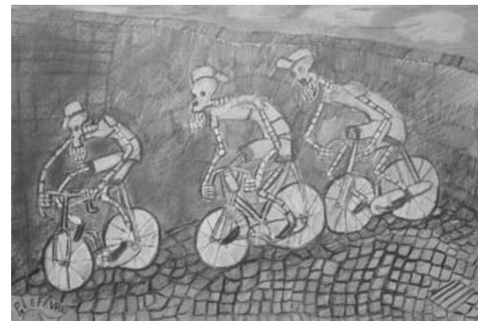
Ultimo sforzo, 1995

Pierre Lefèvre è un'artista belga istintivo e ribelle, respinge la profondità, applica prospettive molteplici e invertite, procede per stratificazione fino a occupare tutto lo spazio, rispettando nel contempo la leggibilità narrativa del soggetto. Aborrisce il vuoto e lo riempie con un tavolino, tre anatre o una pattumiera. Questa mania lo induce a utilizzare elementi di riempimento, come gli scacchi colorati sul pavimento, teschi o grandi sipari teatrali fino – per questo – ad aggiungere all'opera stessa un tono di