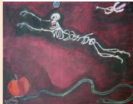
Il passo, 1997

Adamo ed Eva, dopo aver mangiato il frutto dell'albero della conoscenza del bene e del male, vanno incontro ad una punizione certa: la morte. Sin dalla notte dei tempi, l'uomo si pone domande sul perché della morte, ricercando al contempo il senso stesso della propria vita. Nella nostra epoca, la morte è rimossa dalla quotidianità della nostra vita consumistica e secolarizzata ma è, nello stesso tempo, messa in bella mostra dai mezzi di comunicazione di massa, è esibita, palesata, spettacolarizzata. Nei secoli, la morte è rappresentata frequentemente in opere laiche e sacre, nell'arte figurativa e in quella performativa. "Danze Macabre - La figura della Morte nelle arti" è una rassegna che propone al pubblico bergamasco la rappre-