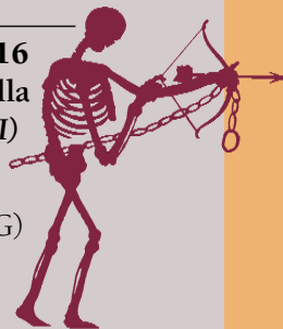
FIGURE IN NERO

Le avventure di Pulcinella Orlando Della Morte (MI) Spettacolo di burattini a guanto Il Pellicano - Treviglio (BG)