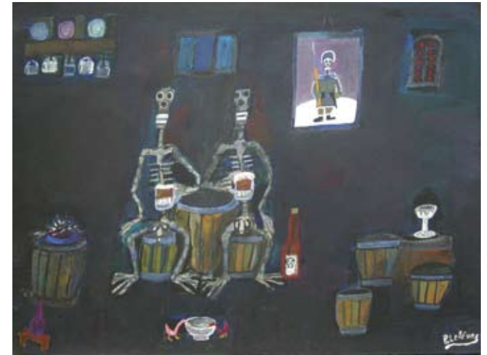
La Morte improvvisa, 1991

Altre opere di Pierre Lefèvre sono espone fino al 30 giugno 2011 in Belgio, nell'ambito della mostra "Le BEAU, Le BRUT et Le NAÏF", presso gli uffici de la Commission Communautaire Française ubicata al 42, Rue des Palais 1030 Bruxelles