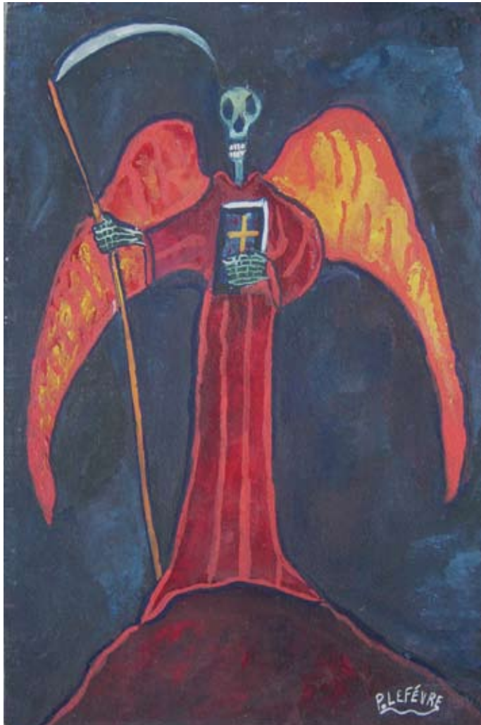
L'angelo della morte, 1970

Altre opere di Pierre Lefèvre sono espone fino al 30 giugno 2011 in Belgio, nell'ambito della mostra "Le BEAU, Le BRUT et Le NAÏF", presso gli uffici de la Commission Communautaire Française ubicata al 42, Rue des Palais 1030 Bruxelles