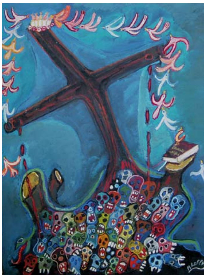
La croce e la bibbia, 1984

Provincia di Bergamo, Spazio Viterbi via Torquato Tasso, Bergamo